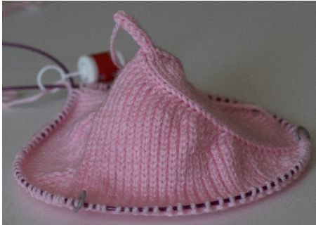
Parte externa (frente)

Deixe uns 25 cm e corte o fio. Com agulha de costura, passe por dentro dos pts remanescentes e deixe folga para entrar o enchimento. Após a colocação do enchimento (fibra) arremate bem para que o fio não apareça.